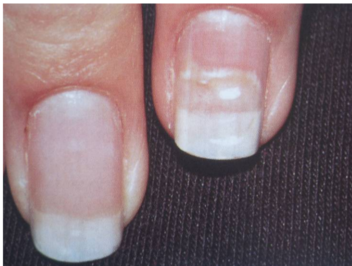
PHOTO 7 : ONYCHOLYSE POSSIBLE EN CAS DE DERMITE ALLERGIQUE DE CONTACT

Koïlonychies (liquides de permanentes) : ongles incurvés, concaves à leur partie médiane avec relèvement des bords latéraux.